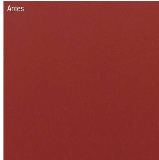
Pintura ignífuga RAPTOR Roja 1000°C